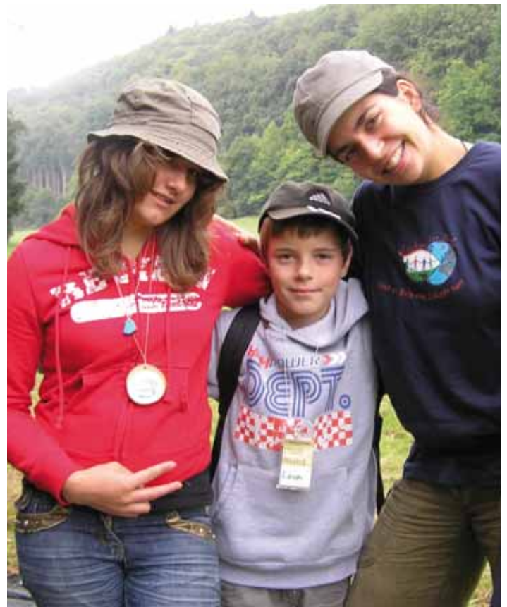
Erdschützerjugendbegleiter – kreative Aufgabe mit Spaß

http://www.schuetzer-der-erde.de/zukunftspioniere/